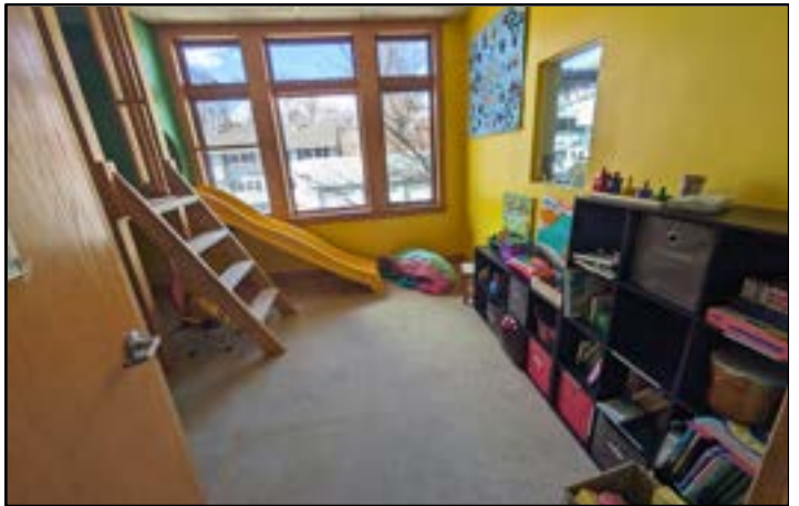
sala de juegos comunitaria