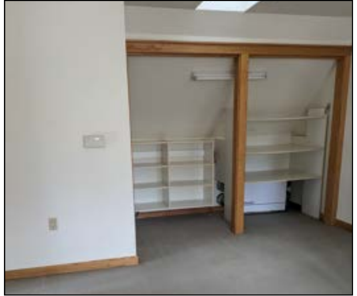
Carmario" or "clóset